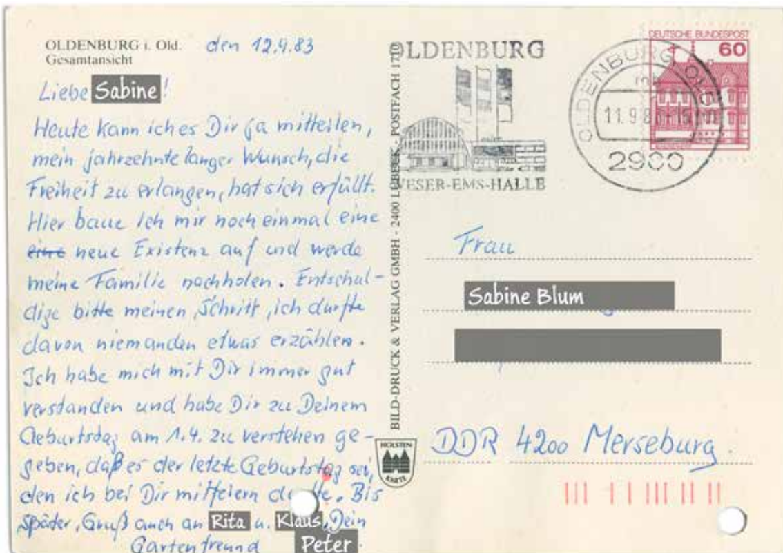
Landesarchiv Sachsen-Anhalt, M 556 Volkspolizei-Kreisamt Merseburg, Nr. 3334, Foto 1 (RS).