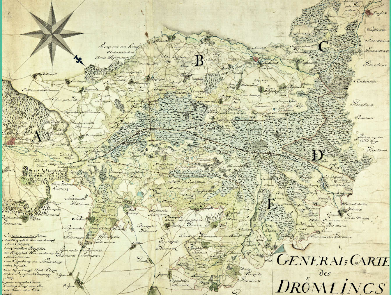
Generalkarte des Drömlings, o.D. (LASA, C 28, IIIb Forstkarten, XXIII Nr. 60)

werbe in der Altmark mit Informationen zu Innungen und Zünften der verschiedensten Gewerke auf. Im Zusammenhang mit der Ausübung der Kommunalaufsicht der Regierung entstandene Unterlagen sind deren Kommunalregistratur zugeordnet (C 28 Ie I Spezialia Städte, C 28 Ie II Spezialia Landgemeinden und C 28 Ie III Neue Kommunalregistratur). Neben Informationen zu allgemeinen Verwaltungsangelegenheiten altmärkischer Städte und Landgemeinden, wie zur Wahl von Bürgermeistern und Beigeordneten, zur Ernennung von Stadträten, zu Stadtverordnetenversammlungen, zu städtischen und Kreissparkassen sind hier zumeist auch Angaben zu sogenannten Armensachen mit Unterlagen zu Hospitälern, Stiftungen und Armenkassen, zu Kommunalbauten und Kämmereisachen der Gemeinden zu finden. Umfassende Ergänzungen der Landratsamtsbestände können Akten der Kirchen- und Schulabteilung der Regierung Magdeburg (C 28 II) zu kirchen- und schulgeschichtlichen Themen sowie zur Geschichte von Stiftungen und Stipendien enthalten. Die in der Regel nach Kirchen- bzw. Schulort geführten Akten betreffen entsprechend dem in der Altmark vorherrschenden evangelischen Glaubensbekenntnis in erster Linie evangelische Kirchen und Gemeinden, aber auch dort existierende katholische sowie jüdi-