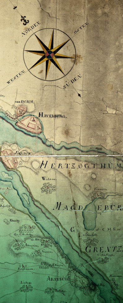
Karte von dem großen Durchbruch der Elbe in die Alte Mark vom 27. März 1771 (LASA, C 28 IX, B VII Nr. 3)